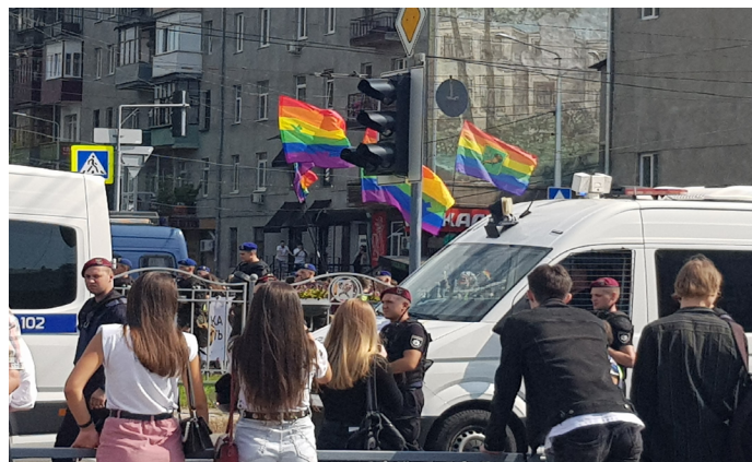
Прайд марш у Харкові 12 серпня 2021 року

Розі. За фактом розклеювання в Одесі листівок із фотографіями представників ЛГБТІ-спільноти та організаторів прайду з написом «знай свого ворога» національна поліція порушила кримінальну справу за статтею 161 (розпалювання ненависті або порушення рівноправності громадян за ознакою упередженості) Кримінального кодексу.