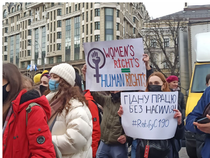
Жіночий марш 8 березня 2021 року в Києві.

Виконуючи свою роботу, правозахисники та правозахисниці продовжили зазнавати нападів та стикатись з психологічним насильством онлайн. Правозахисниці та особи, які захищають права жінок, а також екологічні активісти та активістки особливо часто зазнавали нападів. В одному випадку, 5 лютого 2021 року, невідомі спалили автомобілі екоактивіста та екоактивістки і кинули гранату в їхній будинок. ММПЛУ також зафіксувала фізичні напади крайніх правих груп на учасниць і учасників маршу до Міжнародного жіночого дня 8 березня 2021 року в Києві. Правоохоронці належним чином відреагували на спроби крайніх правих груп зірвати аналогічні марші в Одесі та Дніпрі.