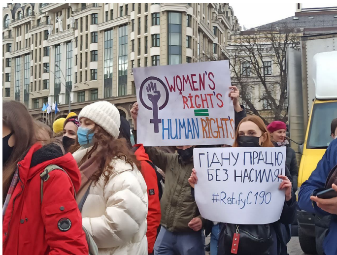
Женский марш 8 марта 2021 года в Киеве.

насилием онлайн. Правозащитницы и лица, защищающие права женщин, а также экологические активисты и активистки особенно часто подвергались нападениям. В одном случае, 5 февраля 2021 года, неизвестные сожгли автомобили экоактивиста и экоактивистки и бросили гранату в их дом. ММПЧУ также зафиксировала физические нападения крайних правых групп на участников и участниц шествий в честь Международного женского дня 8 марта 2021 года в Киеве. Попытки крайних правых групп сорвать аналогичные шествия в Одессе и Днепре были должным образом пресечены правоохранителями.