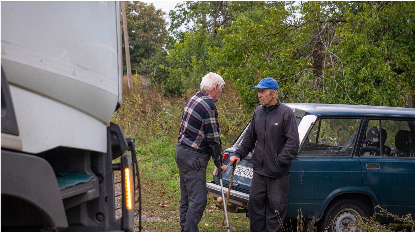
Двоє літніх чоловіків з села Високопілля Херсонської області, яке до вересня 2022 року було під контролем Збройних сил Російської Федерації.

Діти, які проживали в інтернатних закладах, були переміщені російською окупаційною владою до Автономної Республіки Крим, окупованої Російською Федерацією («Крим»), без згоди їхніх батьків або без надання батькам інформації. В одному випадку мати 16-річного хлопчика з інтелектуальною формою інвалідності дізналася з соціальних мереж, що на початку листопада 2022 року її син був переміщений російською окупаційною владою з будинку-інтернату в Олешках, окупованому місті Херсонської області, до Криму. Щоби возз'єднатися із сином, її попросили забрати його особисто, але вона не могла дозволити собі поїздку до Криму через треті країни та Російську Федерацію. Зрештою,